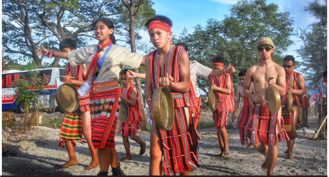
PATRIOTIC seems to be the depiction of the Igorot tribe as they proudly displays their unwavering love on their treasured way of living.

| MARC JAY R. DUQUE / JOSEPH CLYDE FAMILARCANO