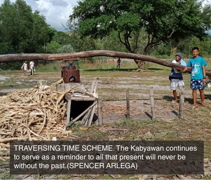
TRAVERSING TIME SCHEME. The Kabyawan continues to serve as a reminder to all that present will never be without the past.