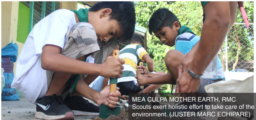
MEA CULPA MOTHER EARTH. RMC Scouts exert holistic effort to take care of the environment. (JUSTER MARC ECHIPARE)

"Masaya ako dahil ako ang nanalo at nagpapasalamat ako kay Lord kasi ginabayan niya ako," pangwakas ni Catubig.